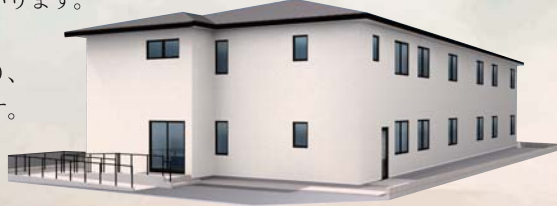
※イメージベースにつき実際とは多少異なる場合があります。

入居様をやさしく見守る体制で、ご面会も自由。ユニット型を採用することにより、目が届きやすく、寂しくない暮らしが実現します。